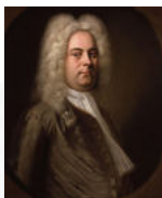
Georg Friedrich Händel - Hudba k ohňostroji