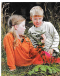
Z knihy Pohádkový rok, upraveno ilustrace Zdeněk Smetana

Ptáci létali ocáskem dopředu, jsou z nich holátka a zavřelo se za nimi vajíčko. Sluníčko běželo pozpátku po nebi. „Nedáš si říct,“ povídá výrovi Křemílek. „Nedám,“ zahuhlal výr Ouško. A tak si Křemílek došel do chaloupky pro Vochoomůrku a namířil ho nosem na výra. Vochoomůrka chvíli táhl vzduch a třikrát kýchl jako z brokovnice. Výr Ouško pustil hodiny, Křemílek s Vochoomůrkou je odnesli domů do světnice a pověsili zpátky na zeď, aby se už nepletlo páté přes deváté.