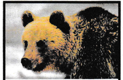
Druh: medvěd hnědý Latinský název: Ursus arctos Výška: 87-126 cm Hmotnost: 100-350 kg

Zvířata se v zimním období potýkají s nedostatkem potravy. Na zimu si proto připravují zásoby. Například medvědi si musí do konce podzimu nashromáždit dostatečné množství tukových zásob, díky kterým přežijí zimu. Ke své obvyklé hmotnosti proto přibírají dalších sto kilogramů. Aby jim tyto zásoby vydržely co nejdéle, upadají medvědi do nepravého zimního spánku. Nespí sice celou zimu, občas se probudí, ale zpomalí se jim srdeční tep a dýchání a jejich tělesná teplota o něco poklesne. Díky tomu jim k přežití stačí velmi málo energie a nashromážděné zásoby tuku v těle jim vydrží po dlouhé měsíce. Tak mohou medvědi přežít zimní období, kdy by nenašli dostatek potravy.